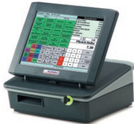
Abbildung: INKA 440 mit Bondrucker