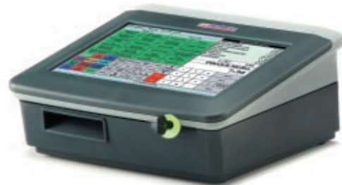
Abbildung: INKA 430 mit Bondrucker