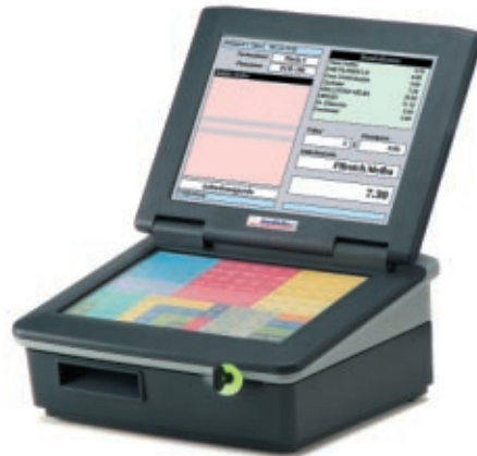
Abbildung: INKA 400 mit Bondrucker